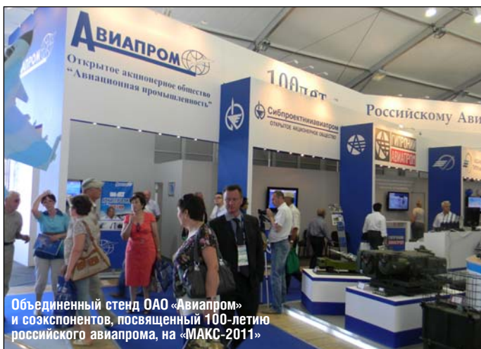
Объединенный стенд ОАО «Авиапром» и созкспонентов, посвященный 100-летию российского авиапрома, на «МАКС-2011»

ОАО «Авиапром» динамично развивается, наращивая вклад в возрождение былой славы отечественного авиастроения, пополняется молодыми высококвалифицированными кадрами и при этом остается верным принципам и традициям, заложенным его основателями, — руководителями и ведущими специалистами Министерства авиационной промышленности СССР. □